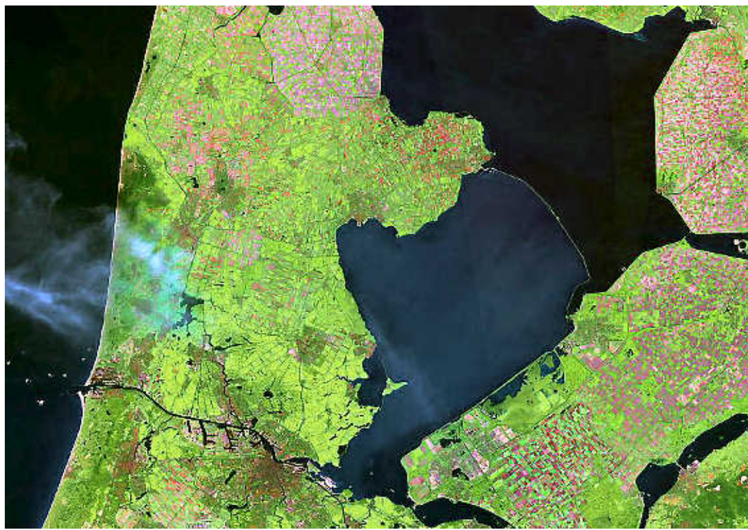
De afwijkende kleur van het Marker- en IJmeer verraadt de aanwezigheid van veel slib.

Met 'lufwetschermen' kan het slib worden gestuurd. Met deze nieuwe methode wordt momenteel een proef genomen voor de kust van Zeevang. De Werkmaatschappij denkt nu aan zo'n 15 kilometer scherm tussen Hoorn en Edam, in plaats van 30 kilometer. Ook wordt voorgesteld om af te zien van een flink aantal lufwetschermen bij het Hoornse Hop, vanwege belemmering voor de recreatievaart. Door de lufwetschermen hoeft de Markermeerdijk misschien minder ingrijpend worden versterkt. De plannen voor het Marker- en IJmeer worden over langere tijd uitgevoerd. Niet over 15 jaar, maar over 30 jaar. Ook deze fasering levert een aanzienlijke besparing op.