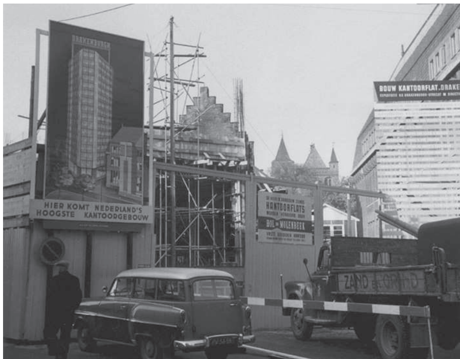
Figuur 8.3 Bouw van de Neudeflat Utrecht