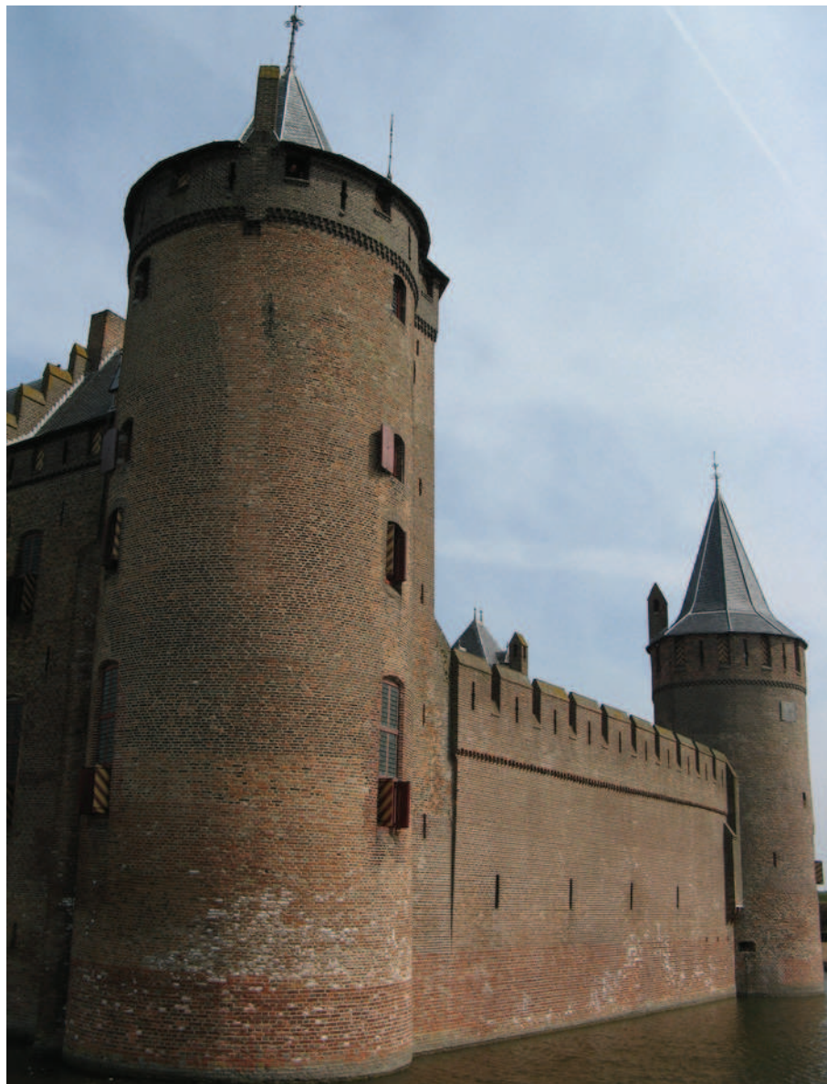
Figuur 8.1 Al in 1825 redde publiek-private samenwerking het Muiderslot van de sloop.