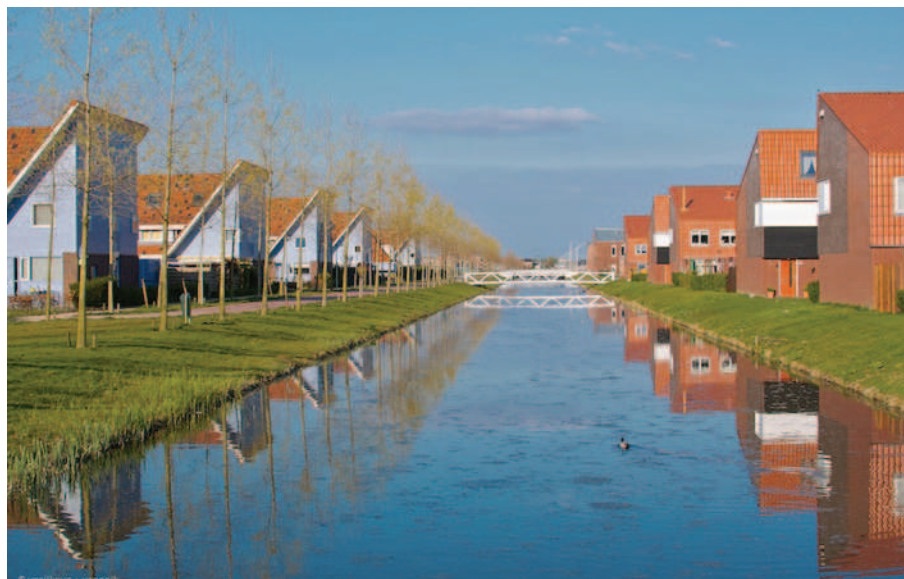
Figuur 8.9 Een typische Vinex-wijk: Ypenburg in Den Haag