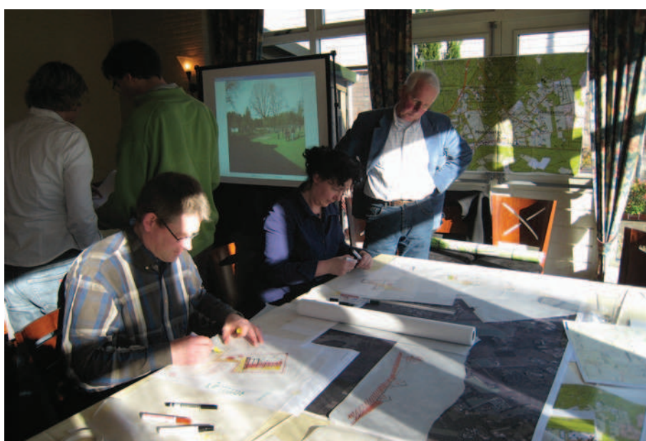
Figuur 8.8 Integraal samenwerken in de vorm van een ‘ontwerpatelier’

Deze verschuivingen in zowel de ruimtelijke planning als de cultuurhistorie maken dat partijen ook nieuwe omgangsvormen met elkaar moeten definiëren. Een belangrijke factor die van invloed is op het succes van ruimtelijke projecten met erfgoed is de wijze waarop de verschillende betrokken partijen binnen deze projecten met elkaar kunnen samenwerken. Of die samenwerking succesvol is, wordt voor een groot deel bepaald door de daartoe benodigde attitude, kennis en competenties vanuit zowel de cultuurhistorie als vanuit de private partijen.