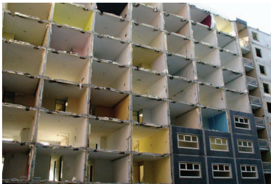
Figuur 8.7 Ruïne van de zwarte Madonna te Den Haag